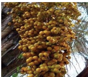
Figura 1. "Cacho de butiá".

de butiá (Figura 1). Presentan un corazón, el endocarpo leñoso, conocido localmente como coquito (Figura 2), extremadamente duro. Este coquito casi esférico, de aproximadamente 15 mm de diámetro, contiene las semillas conocidas popularmente como almendras (Pereira et al. 2008). Los productos comestibles aprovechables del butiá son la pulpa y las almendras.